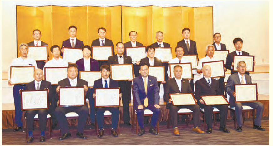
表彰された優秀技術者の皆さん